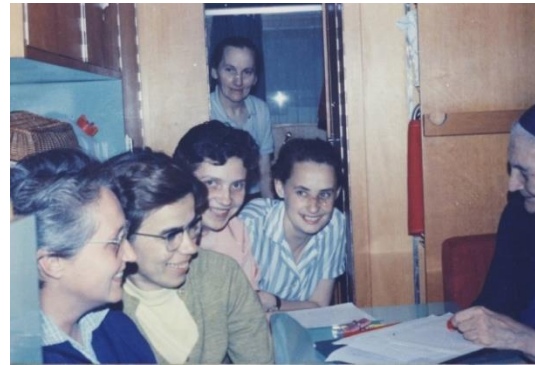
Temesváron egy campingben, a „Hullócsillag” lakókocsiban 1973

”Legyél mindenkinek mindene! ÉlJ Jézus tanújaként az emberek közt, mint a kovász... ami elveszti önmagát, hogy megkelessze a tésztát.”